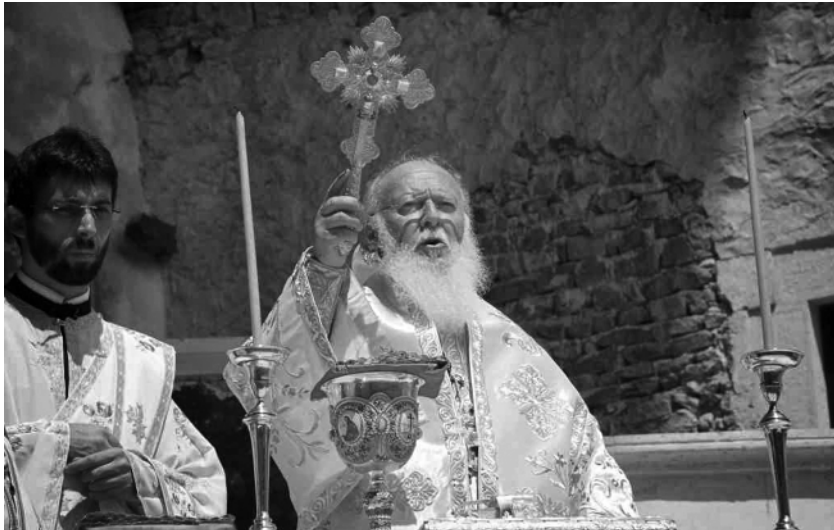
Ἡ Α.Θ.Π. ὁ Οἰκουμενικός Πατριάρχης κ.κ. Βαρθολομαῖος κατά τήν Θεῖαν Λειτουργίαν ἐν τῇ Ι.Μ. Παναγίας Σουμελᾶ Πόντου

Καί τώρα ἐσεῖς, «Ἀπόστολοι ἐκ περάτων, συναθροισθέντες ἐνθάδε, σή Σουμελᾶν τῷ χωρίῳ, κηδεύσατέ μου τό σῶμα· καί σύ Υἱέ καί Θεέ μου, παράλαβέ μου τό πνεῦμα». Ἀμήν.