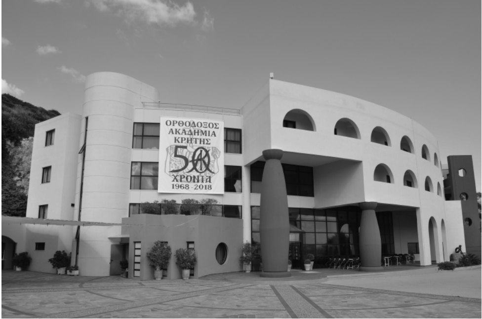
Ἡ Ὀρθόδοξος Ἀκαδημία Κρήτης