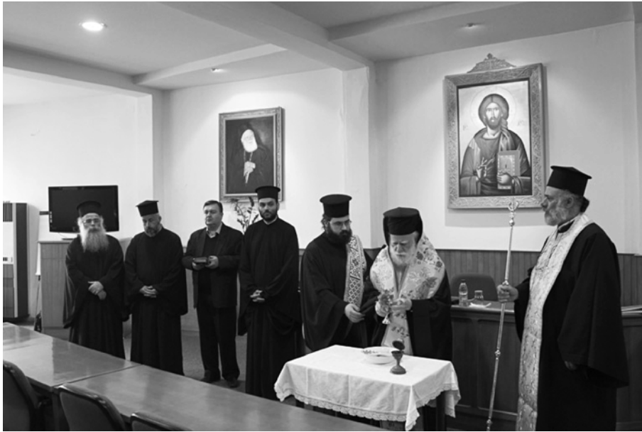
Ὁ Σεβ. Ἀρχιεπίσκοπος Κρήτης κ.κ. Εἰρηναῖος, Πρόεδρος τῆς Ἱερᾶς Ἐπαρχιακῆς Συνόδου τῆς Ἐκκλησίας Κρήτης, τελῶν τὸν ἁγιασμόν τῆς ἐνάρξεως τοῦ Σεμιναρίου