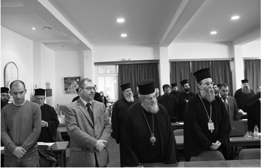
Έκ του Σεμιναρίου επιμόρφωσης αξιολογητών κληρικών