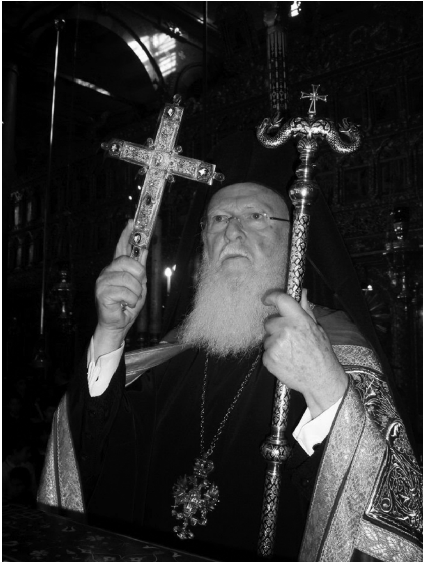
Ἡ Αὐτοῦ Θειοτάτη Παναγιότης ὁ Οἰκουμενικός Πατριάρχης κ.κ. Βαρθολομαῖος