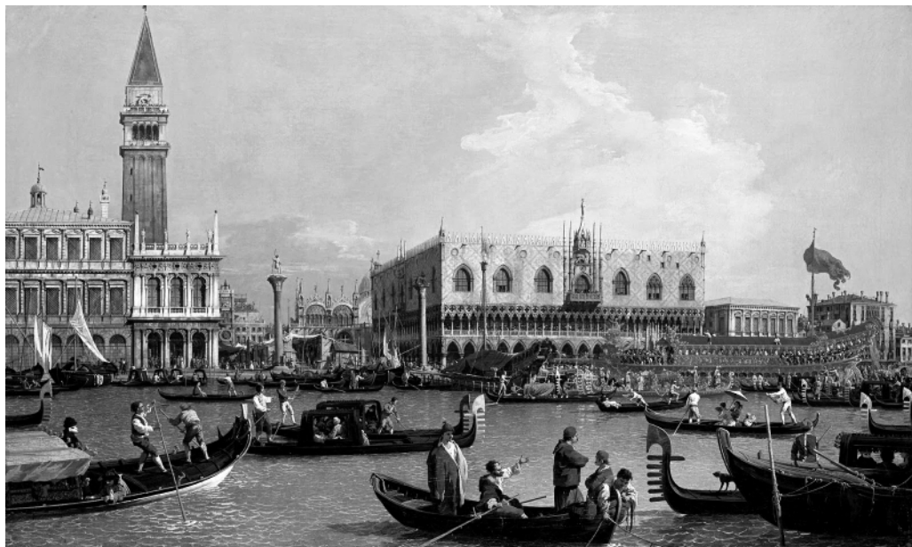
Άπό τήν Μεσαιωνική Βενετία