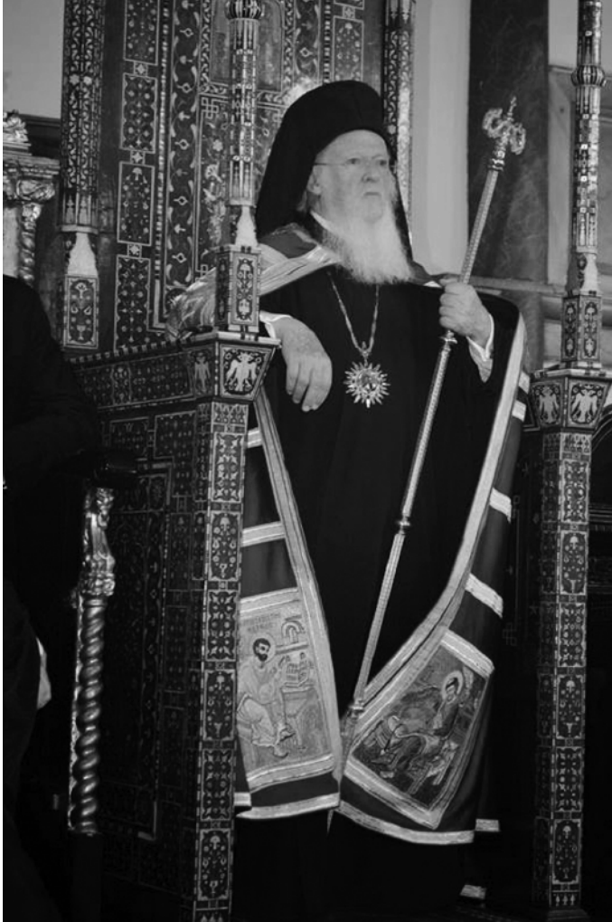
Ἡ Α.Θ.Π. ὁ Οἰκουμενικός Πατριάρχης κ.κ. Βαρθολομαῖος χοροστατῶν ἐν Φαναρίῳ