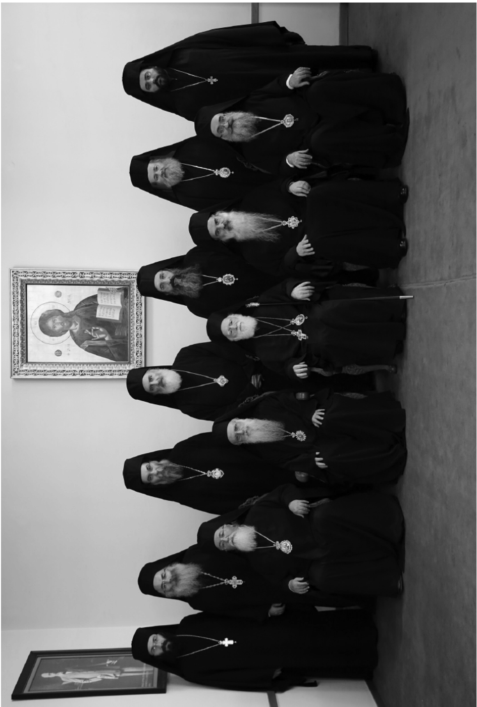
Ἱερά Σύνοδος τῆς Ἐκκλησίας Κρήτης μετά τοῦ Συνοδικοῦ Γραφείου (2014)